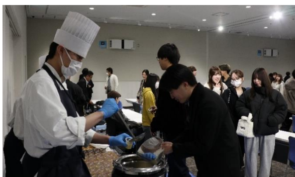
学生開発スムージーの試飲