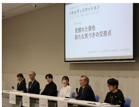
闊達な議論のパネルディスカッション

本シンポジウムは単発の報告会ではなく、学生と地域が関係を結び続けるハブ会議として位置づけられる。今後の展開に向けて、成果の整理と課題の明確化を進めたい。